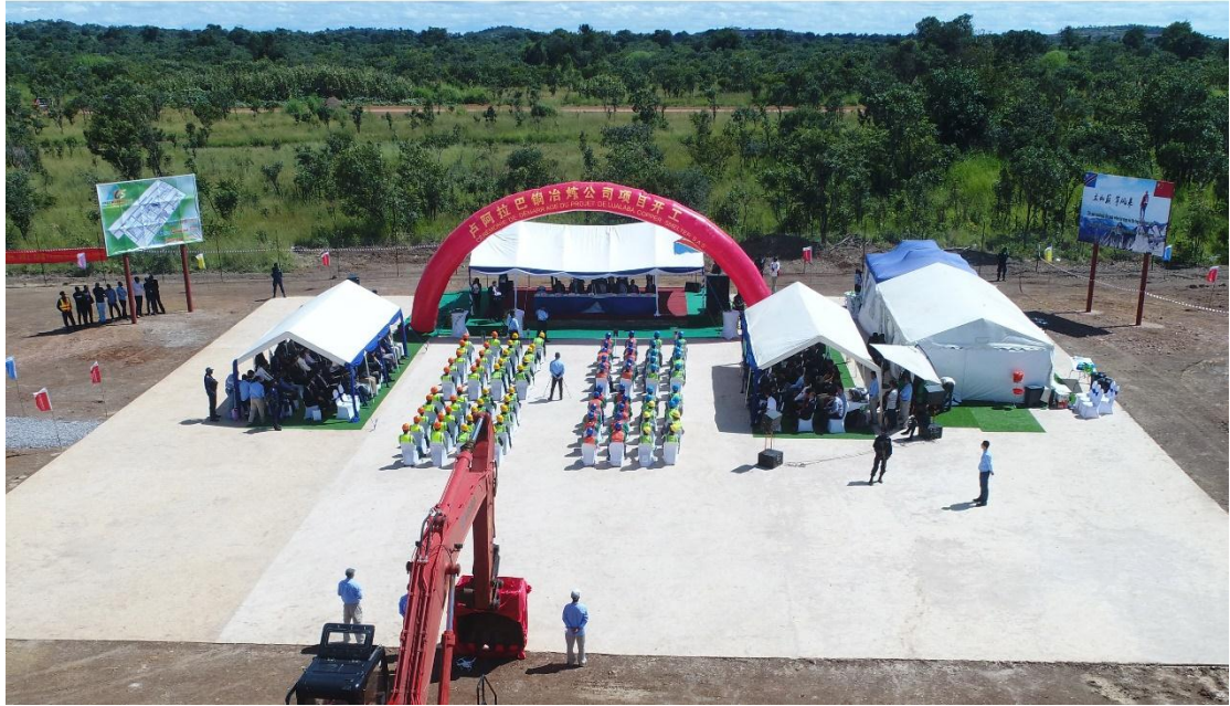
開工動員大會現場